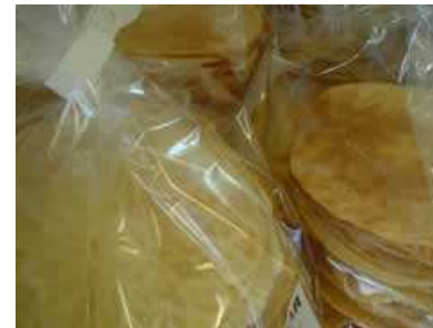
Biscotti alla farina di farro